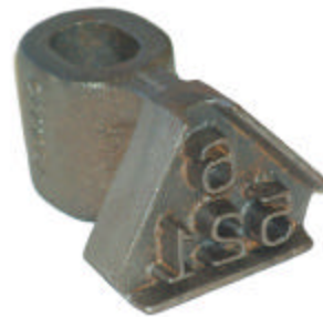
Triangle cassée légère avec poignée, 3.25 livres