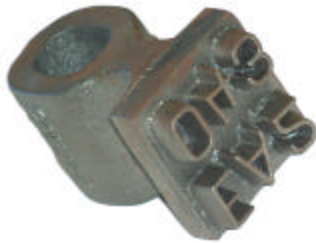
Tête légère de marteaux avec poignée, 3.25 livres

LA FORCE ET LA FIABILITÉ DU FER AVEC MOINS DE POIDS PLUS DURABLE QUE L'ALUMINIUM